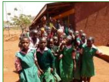
Schoolkinderen zwaaien naar de Cees Wilkeshuisschool